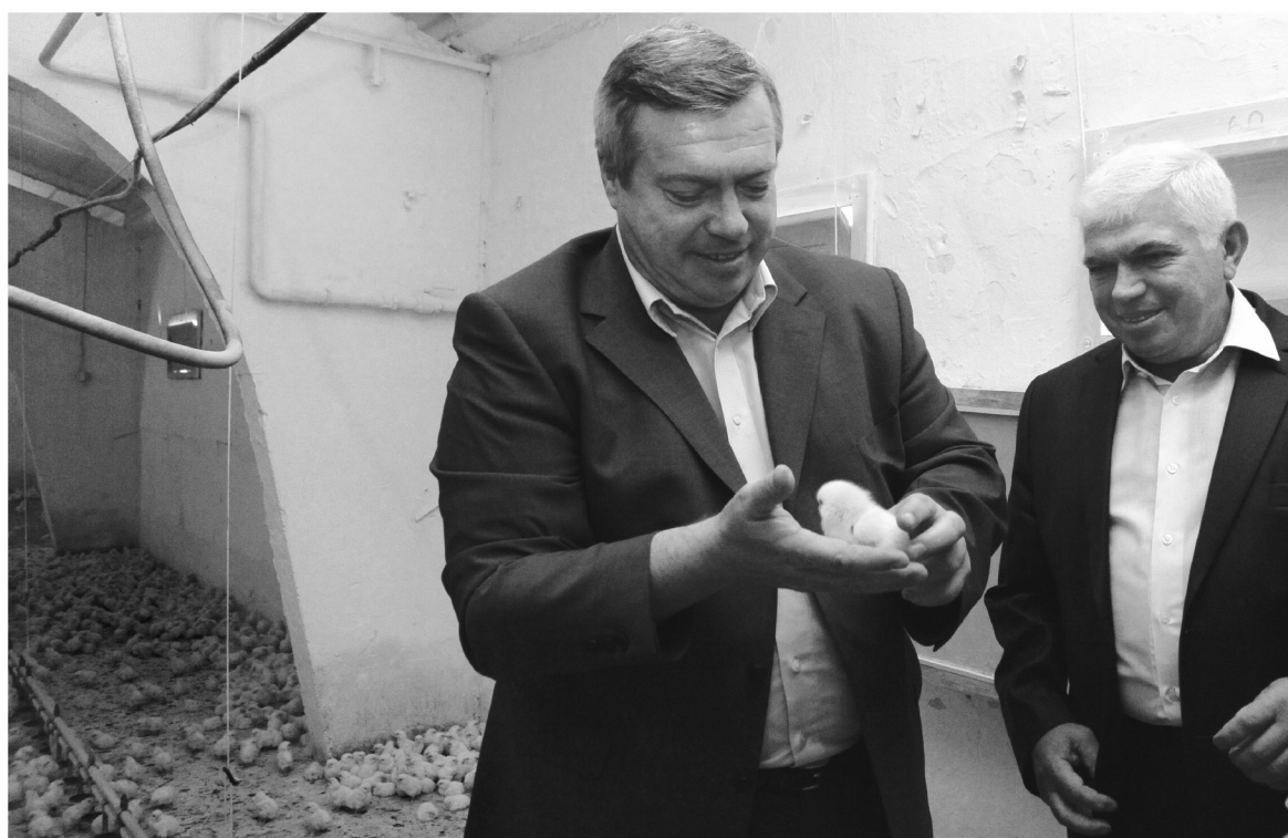
● Компания «Оптифуд» «просто не может умереть»

– Из этой ситуации мы должны сделать выводы – нужно ужесточить ответственность собственников предприятий-банкротов, страховать производство на случай банкротства,